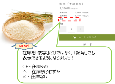
【商品詳細画面】(ショップ画面)