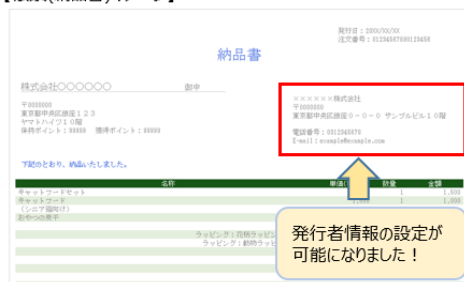
【帳票(納品書)イメージ】