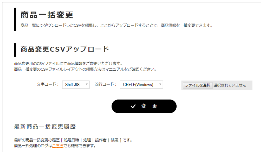
図) 商品一括変更画面

上記、対応内容やメンテナンスの日程につきましては、変更になる可能性がございます。対応の詳細は、メンテナンスの事前にご案内をさせていただきますので予めご了承ください。