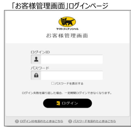
「お客様管理画面」TOPページ